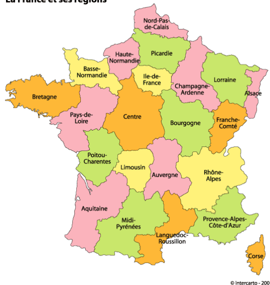
La France et ses régions